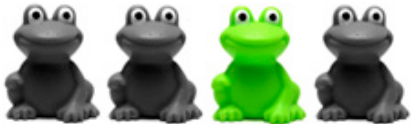
Gleich den „richtigen“ Frosch küssen

Ein Softwareauswahlprozess beinhaltet eine Vielzahl aufeinander aufbauender Schritte. Eine umfassende Anforderungsaufnahme sowie Markt- und Herstelleranalysen gefolgt von der Erstellung aussagekräftiger und formgerechter Ausschreibungsunterlagen bis hin zur Produkt- und Lieferantenauswahl sind Voraussetzungen für eine bedarfsgerechte Produkt- und Lieferantenauswahl. Eine reibungslose Implementierung und Qualitätssicherung runden den erfolgreichen Softwareauswahlprozess ab.